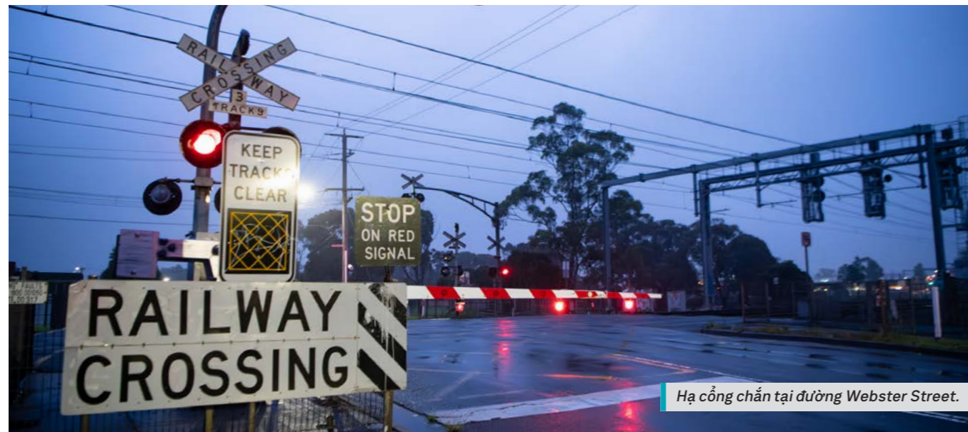
Hạ cổng chắn tại đường Webster Street.

Quét mã QR hoặc truy cập levelcrossings.vic.gov.au/webster-street để đọc báo cáo tham vấn.