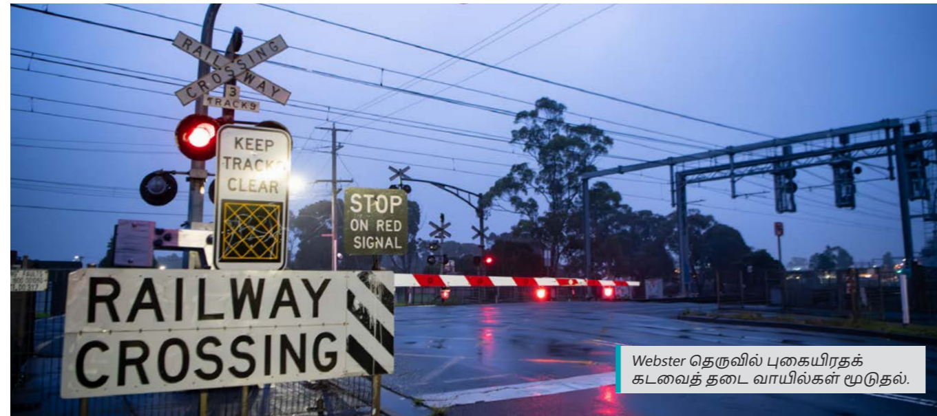
Webster தெருவில் புகையிரதக் கடவைத் தடை வாயில்கள் மூடுதல்.

ஆலோசனை அறிக்கையைப் படிக்க QR குறியீட்டை ஸ்கேன் செய்யவும் அல்லது levelcrossings.vic.gov.au/webster-street ஐப் பார்வையிடவும்.