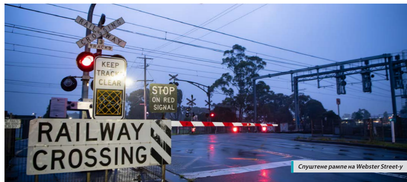
Спуштене рампе на Webster Street-у

Извештај о консултацијама можете да прочитате сканирајући QR-код или ако посетите levelcrossings.vic.gov.au/webster-street