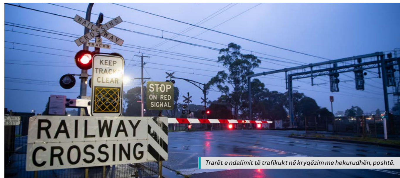
Trarët e ndalimit të trafikut në kryqëzim me hekurudhën, poshtë.

Skani kodin QR ose shikoni: levelcrossings.vic.gov.au/webster-street për ta lexuar raportin e konsultimit.